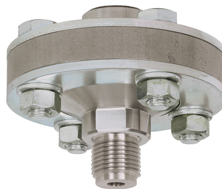
Мембранные разделители с резьбовым присоединением, модель 990.10

„Применение, принцип действия, конструкции“.