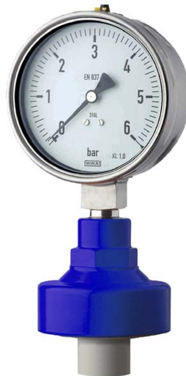
Резьбовое присоединение к процессу, Пластиковая конструкция, Модель 990.31 с манометром 232.50 HP 100