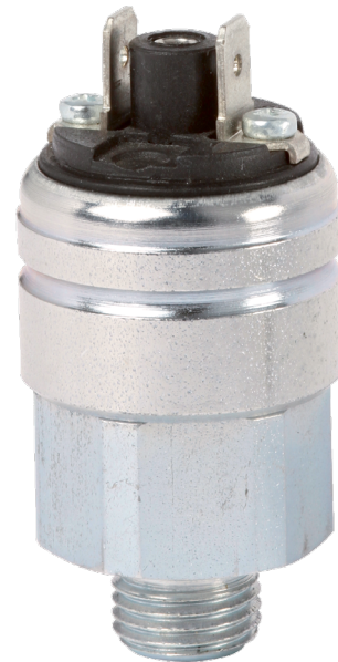
Компактное реле давления, стандартное исполнение, модель PSM06